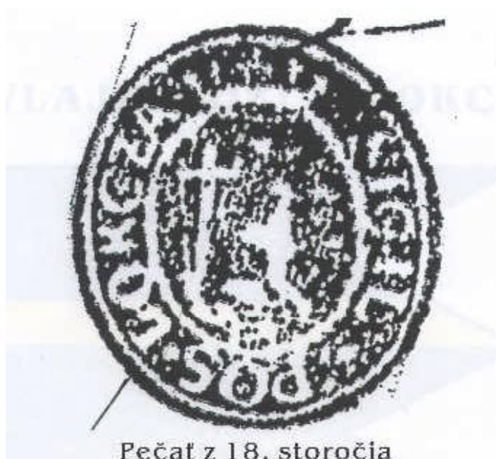
Pečať z 18. storočia